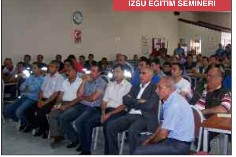
İZSU EĞİTİM SEMİNERİ