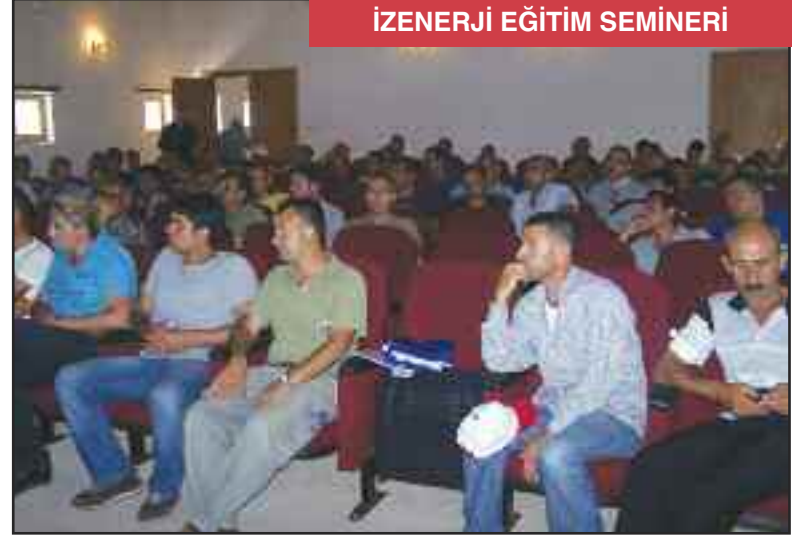
İZENERJİ EĞİTİM SEMİNERİ