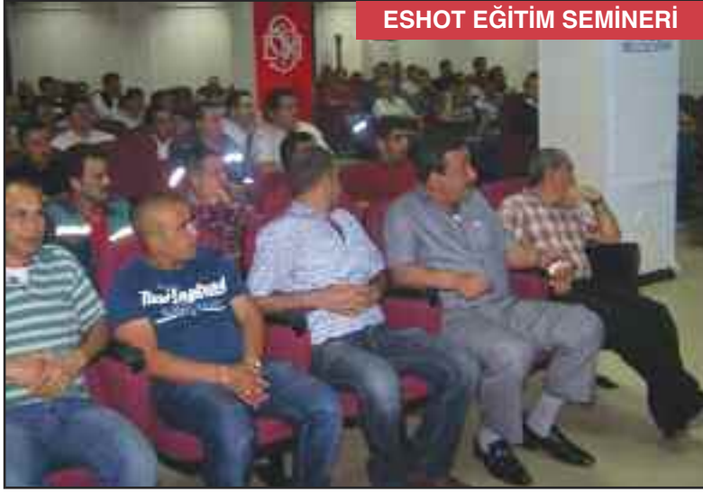
ESHOT EĞİTİM SEMİNERİ