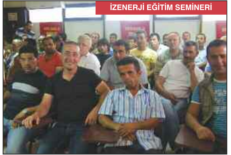
İZENERJİ EĞİTİM SEMİNERİ