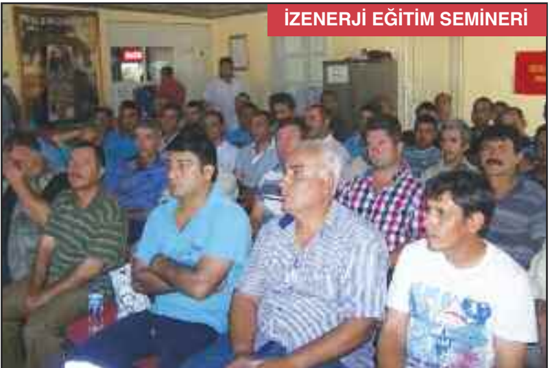
İZENERJİ EĞİTİM SEMİNERİ