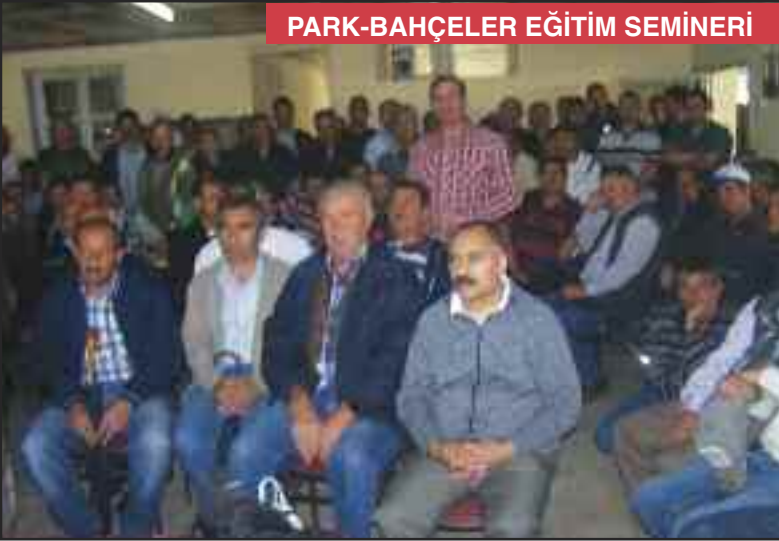
PARK-BAHÇELER EĞİTİM SEMİNERİ