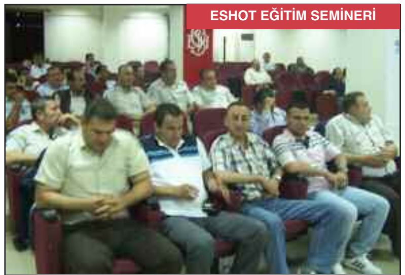
ESHOT EĞİTİM SEMİNERİ