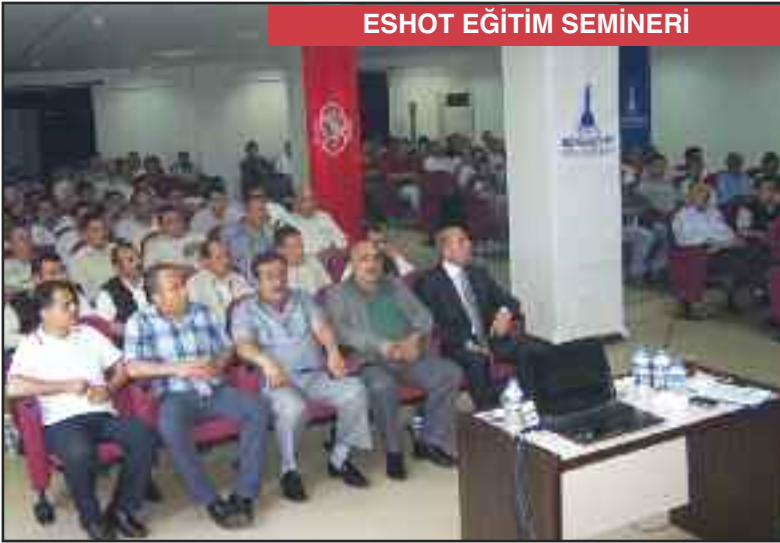
ESHOT EĞİTİM SEMİNERİ