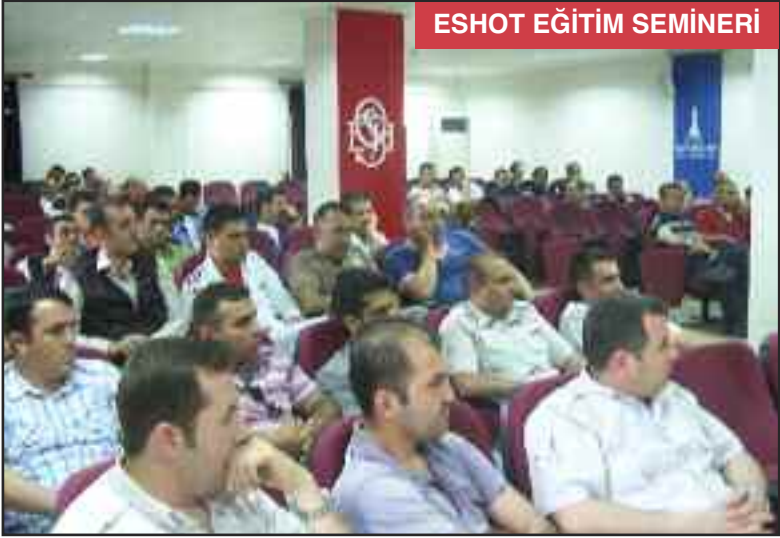
ESHOT EĞİTİM SEMİNERİ