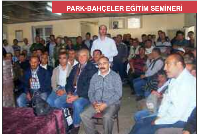
PARK-BAHÇELER EĞİTİM SEMİNERİ