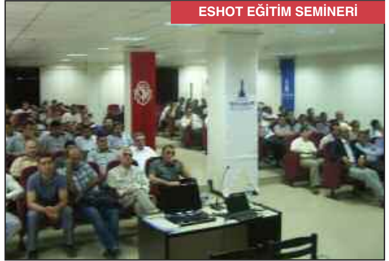
ESHOT EĞİTİM SEMİNERİ