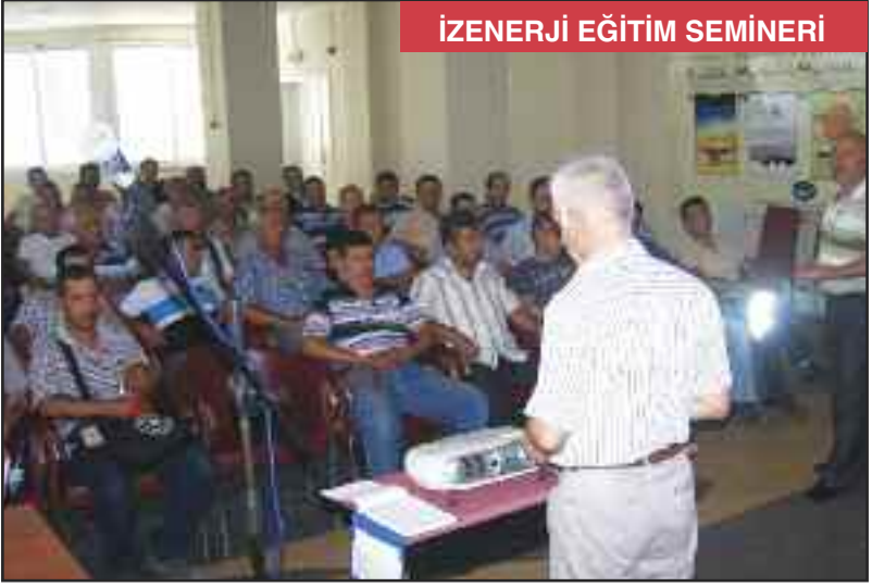
İZENERJİ EĞİTİM SEMİNERİ