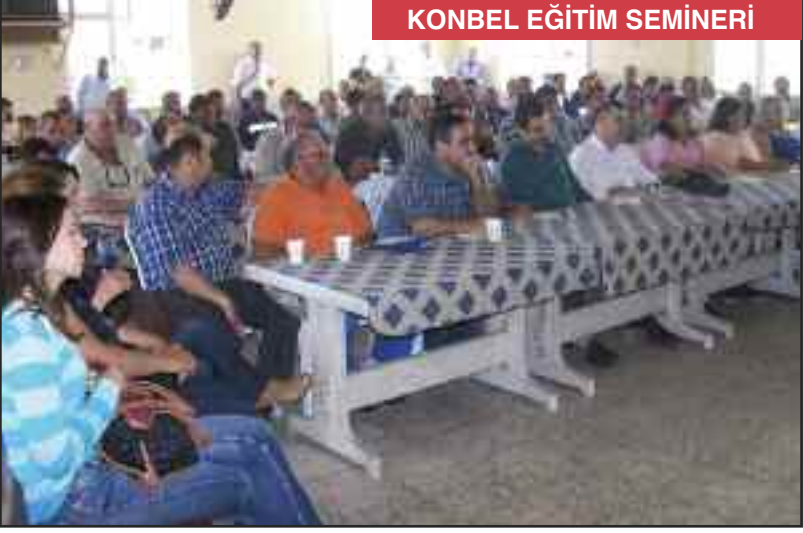
KONBEL EĞİTİM SEMİNERİ