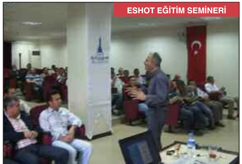
ESHOT EĞİTİM SEMİNERİ