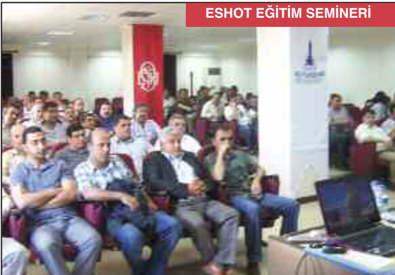
ESHOT EĞİTİM SEMİNERİ