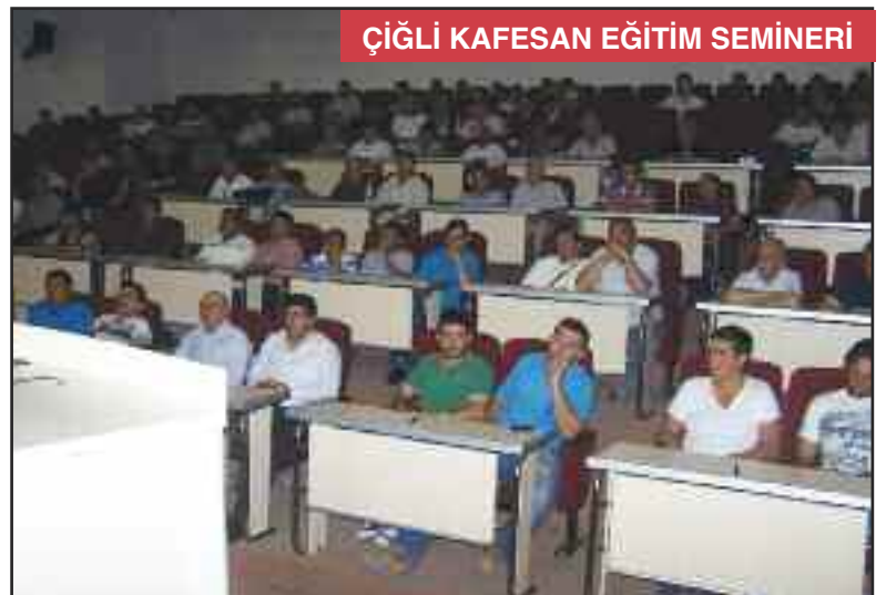
ÇİĞLİ KAFESAN EĞİTİM SEMİNERİ