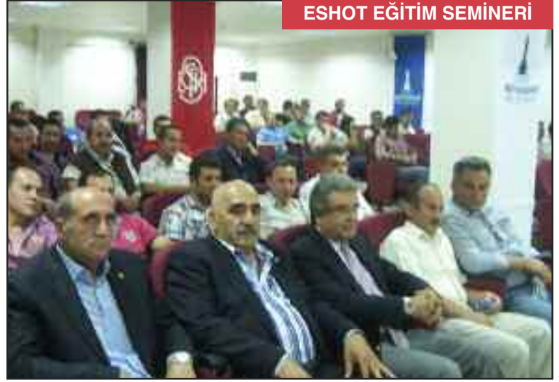
ESHOT EĞİTİM SEMİNERİ