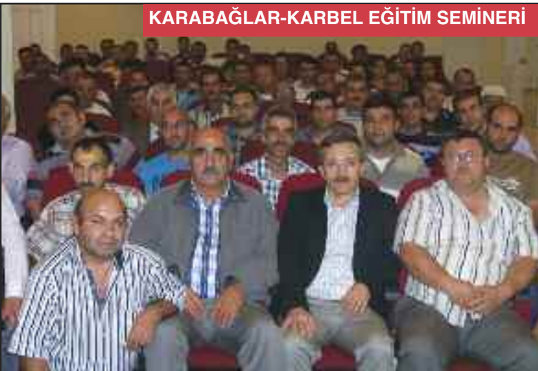
KARABAĞLAR-KARBEL EĞİTİM SEMİNERİ