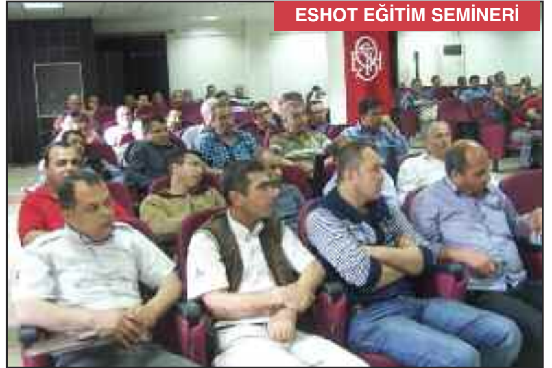
ESHOT EĞİTİM SEMİNERİ