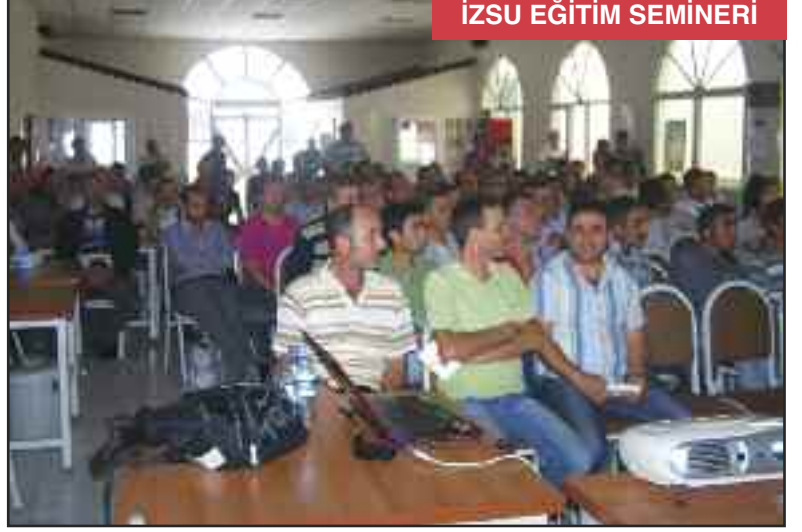
İZSU EĞİTİM SEMİNERİ