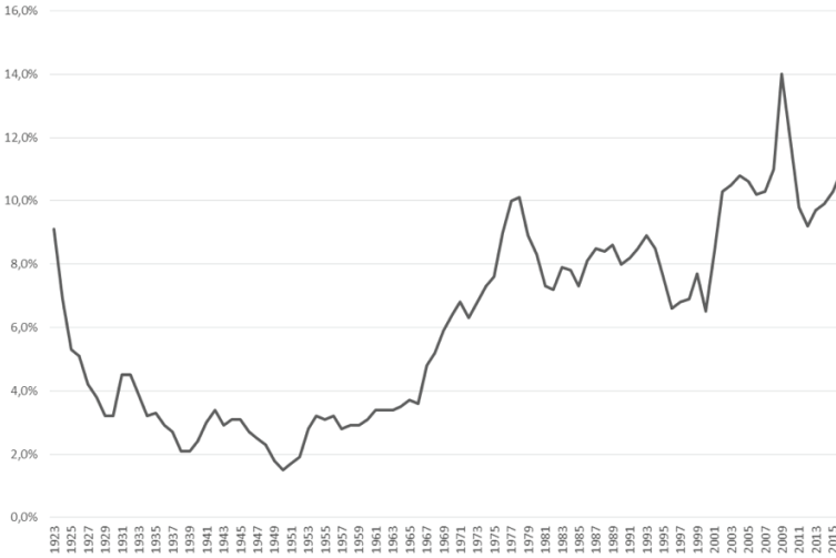
Şekil: Türkiye'de İşsizlik, 1923-2016